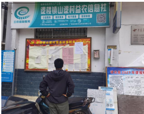
山逻村现场张贴远景