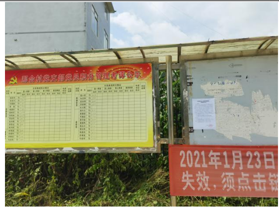
那合村现场张贴近景