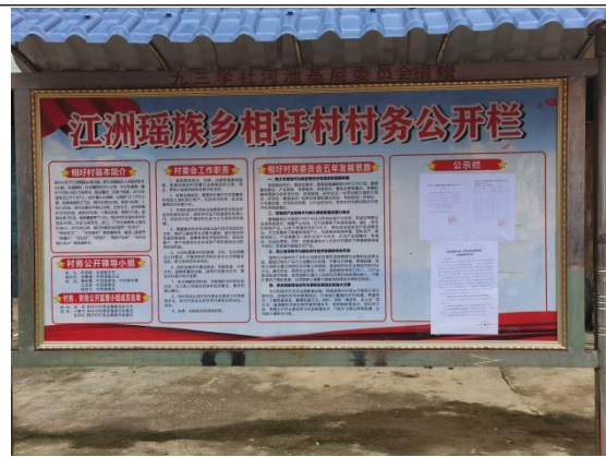
相圩村现场张贴近景