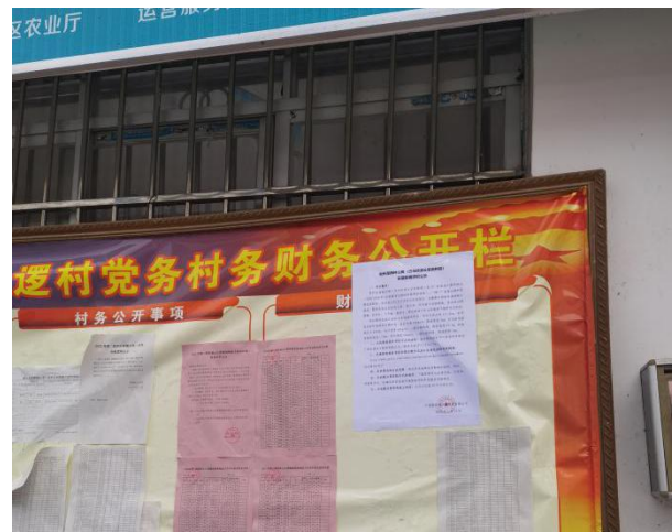
山逻村村现场张贴近景