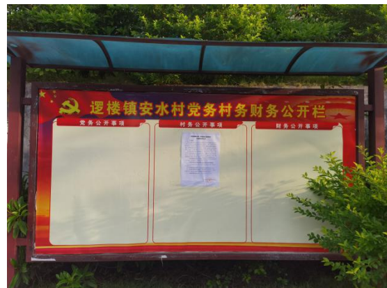
安水村现场张贴近景