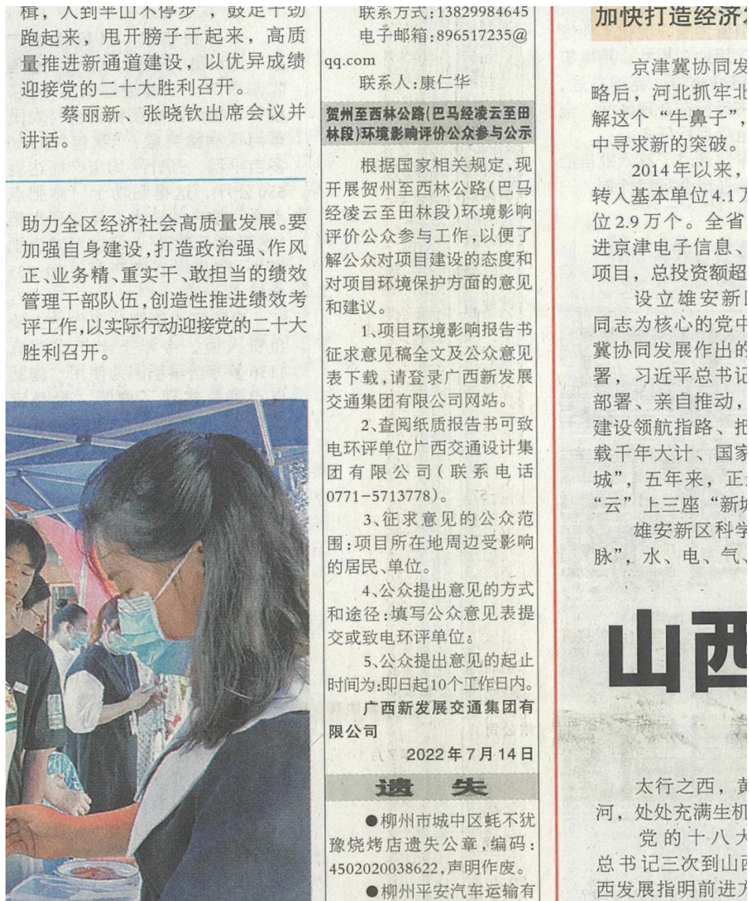
图3 本项目环境影响报告书征求意见稿登报公示照片(第1次)

我单位于2022年7月14日和2022年7月18日分别在广西日报上公示了本项目的环境影响报告书征求意见稿，登报公示照片见图3、图4。