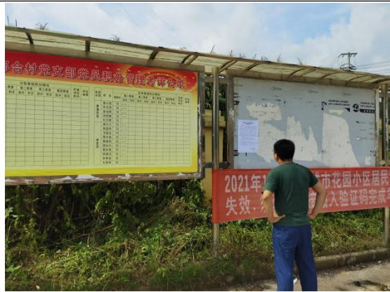
那合村现场张贴远景