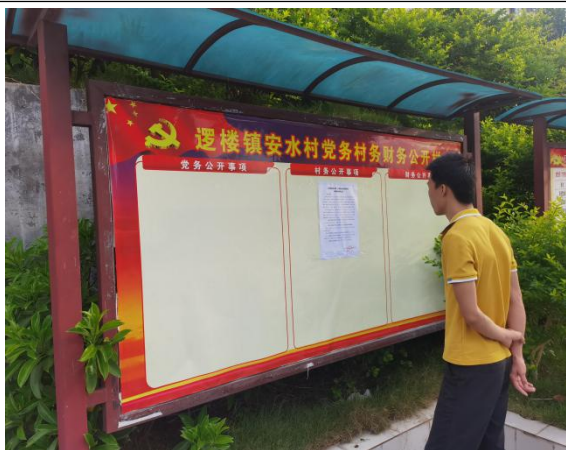
安水村现场张贴远景