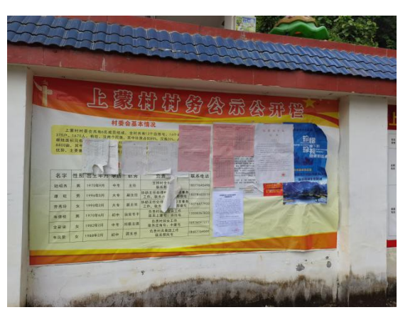
上蒙村现场张贴近景