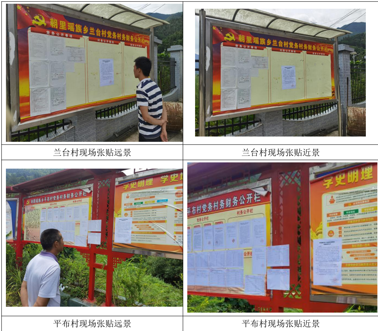
图 5 本项目环境影响报告书征求意见稿张贴情况现场照片