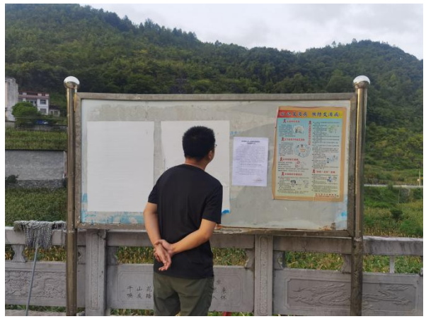
白马村现场张贴近景