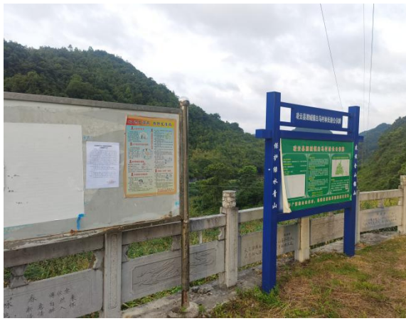
白马村现场张贴远景