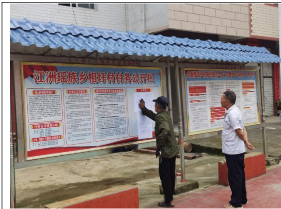
相圩村现场张贴远景