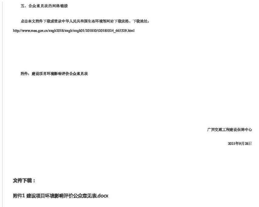
图 1 本项目首次环境影响评价信息网上公开截图