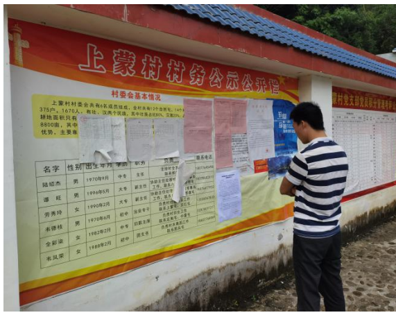
上蒙村现场张贴远景