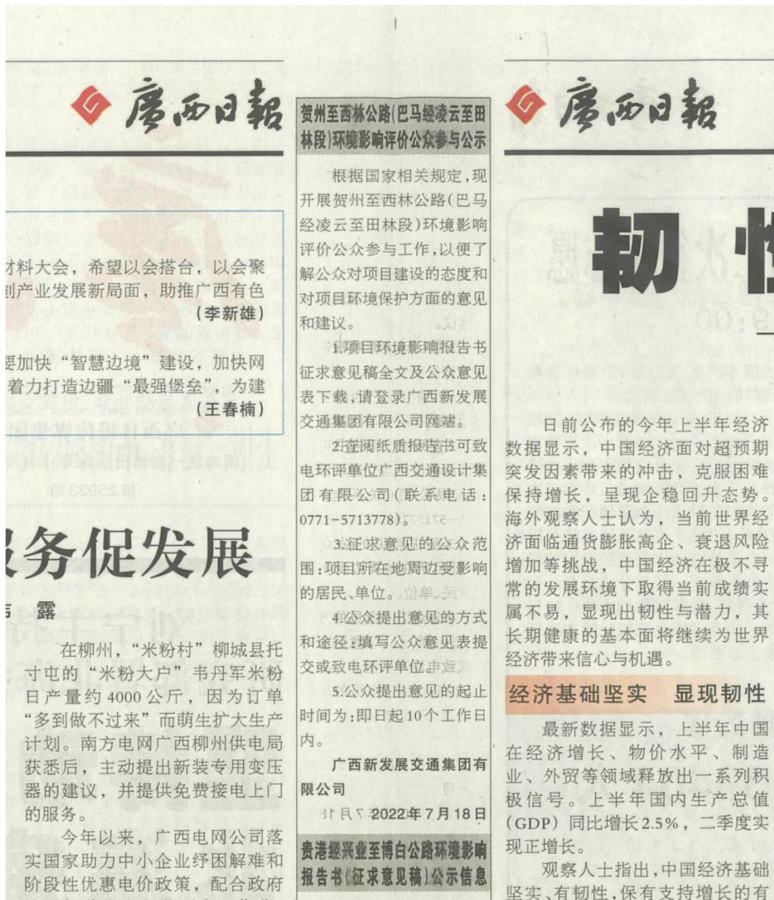
图4 本项目环境影响报告书征求意见稿登报公示照片（第2次）